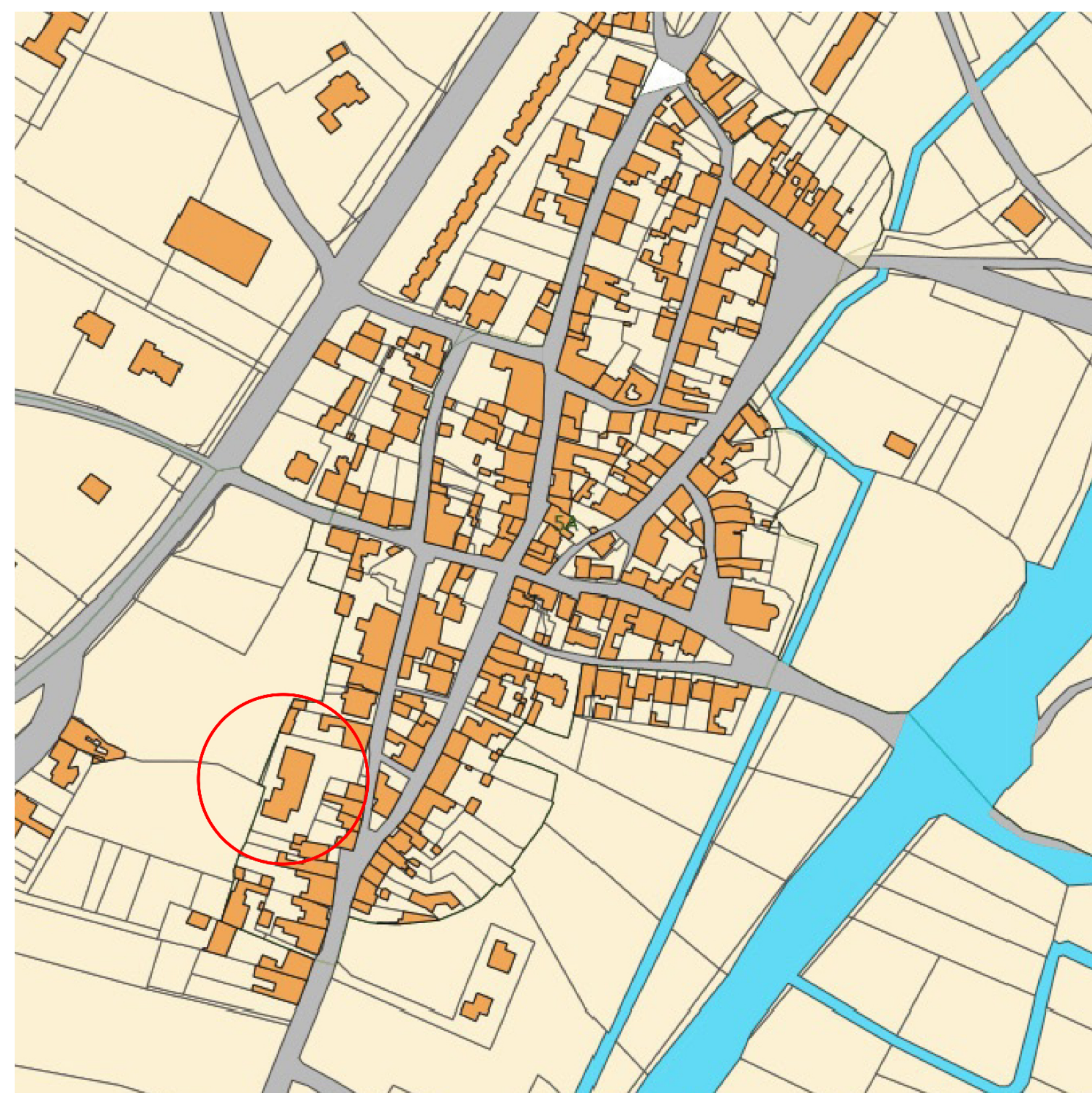
🕒 Planimetria catastale Scala 1:2000