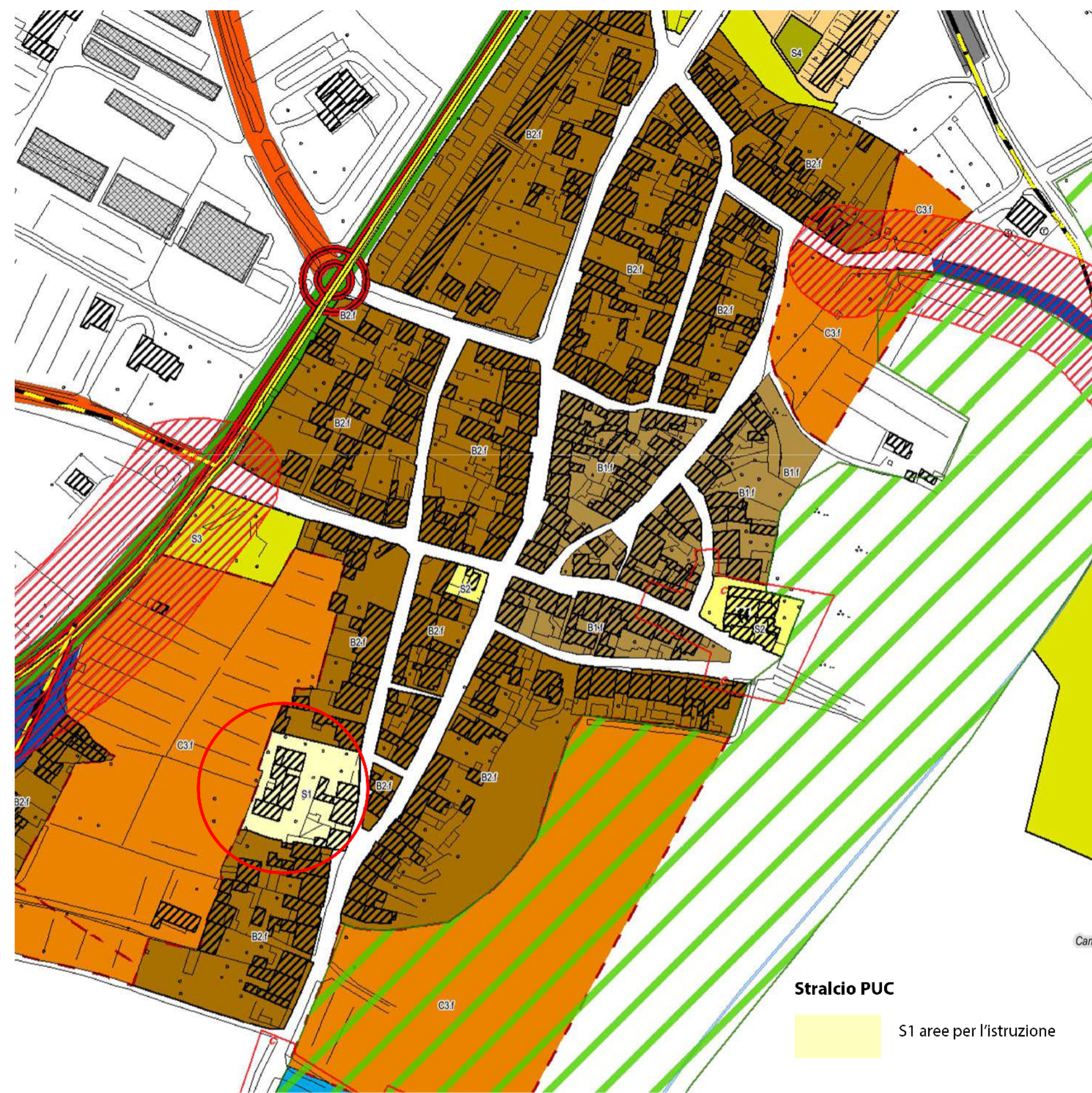
🕒 Stralcio del PUC Scala 1:2000