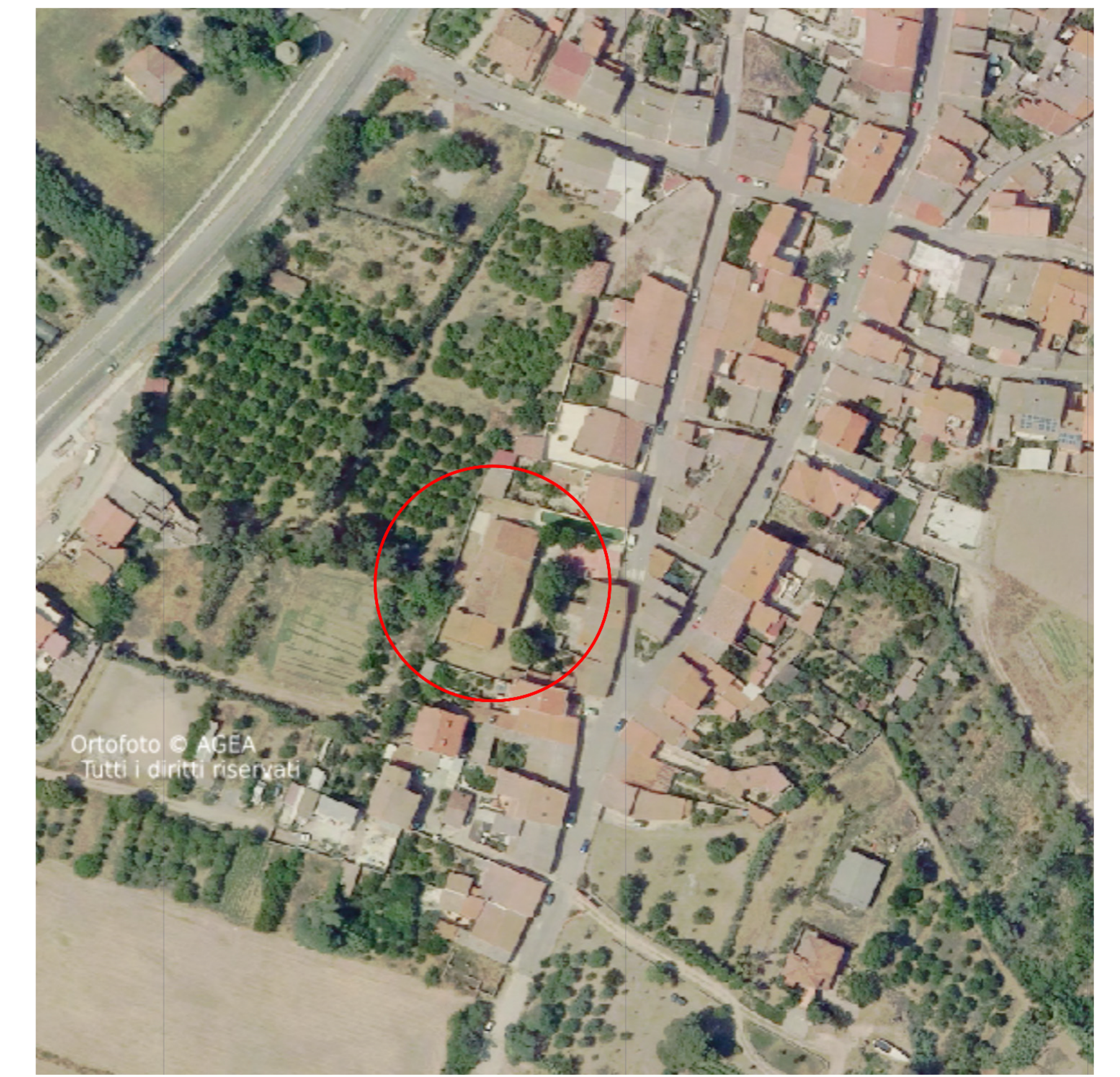
🕒 Ortofoto Scala 1:1000