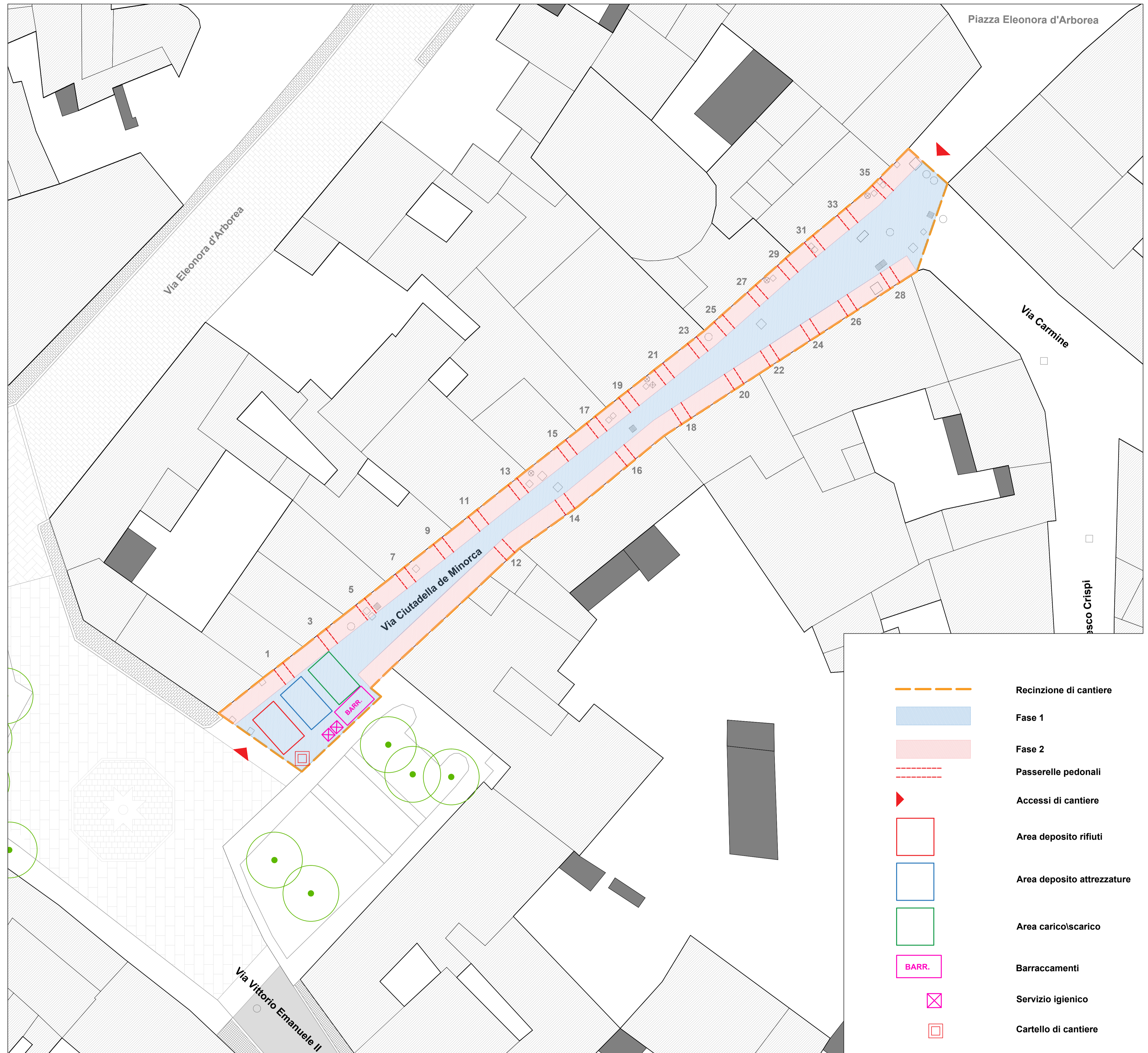
AMBITO VIA CIUATADELLA DE MENORCA - SCALA 1:200