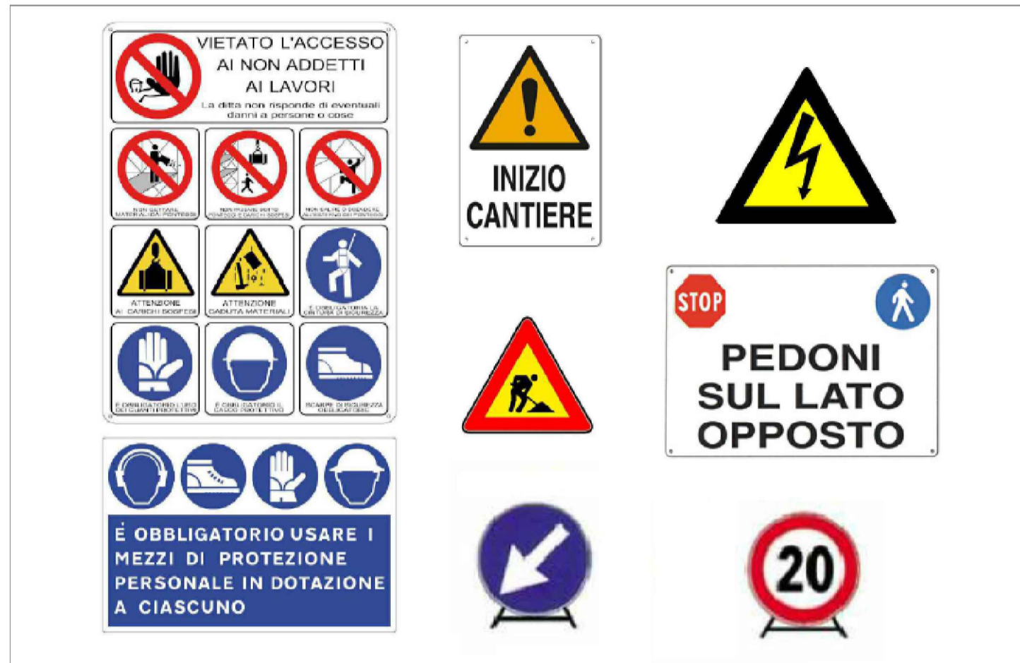
CARTELLONISTICA DI CANTIERE