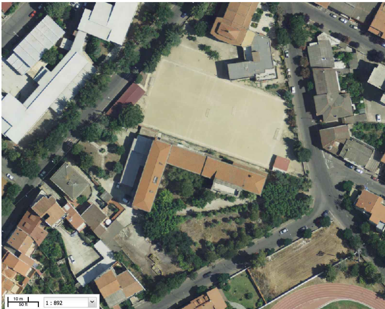
Foto Aerea area d'intervento