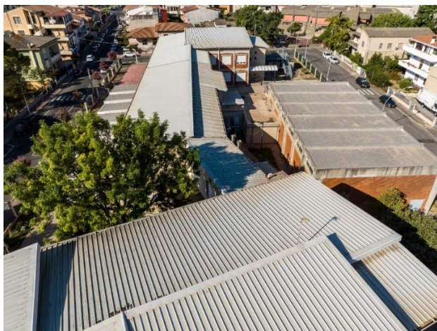
Figura 2: Vista dal drone Scuola Primaria di via Amsicora

Di seguito alcune immagini della zona di intervento: