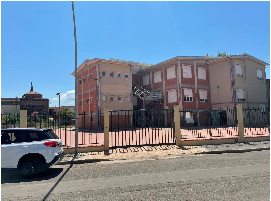
Figura 6: Prospetto posteriore della zona di intervento