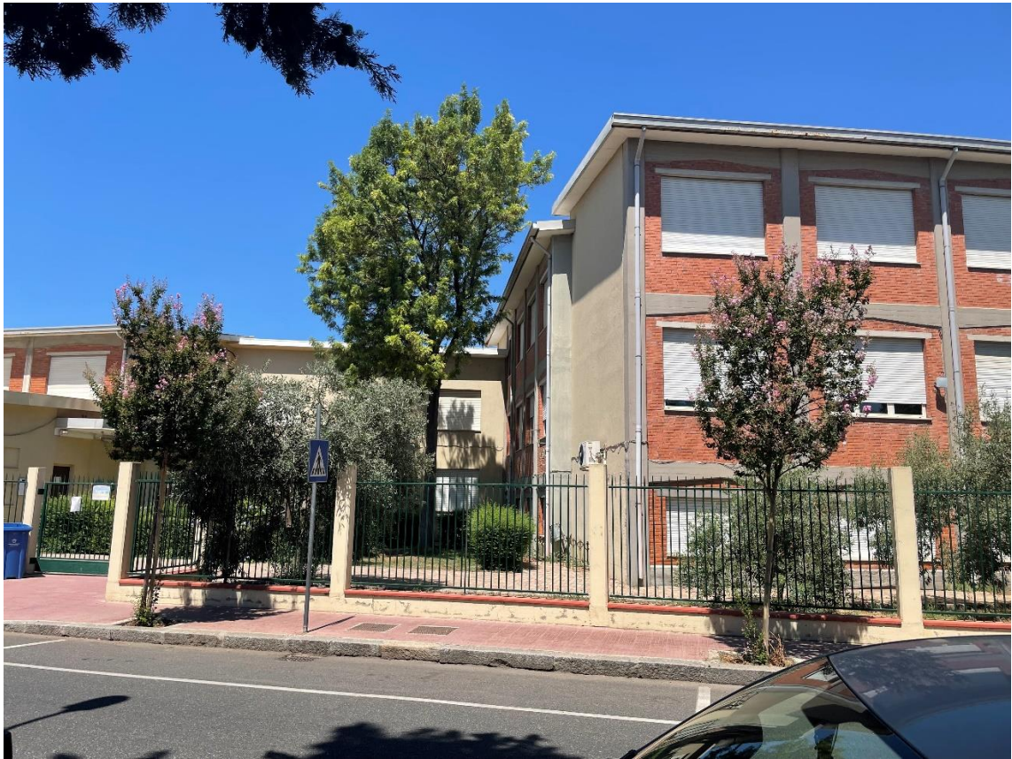
Figura 5: Prospetto anteriore della zona di intervento