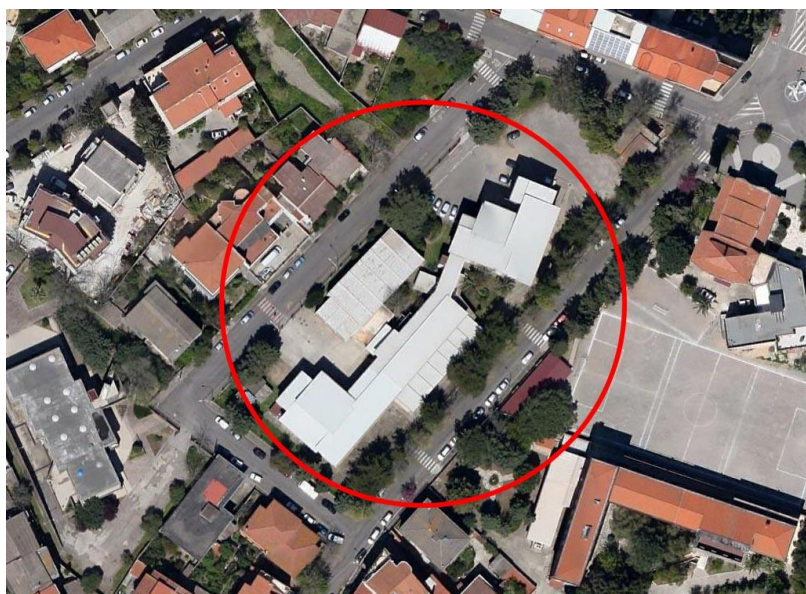
Figura 1: Ubicazione Scuola Primaria di via Amsicora

L'edificio è costituito da 4 corpi di fabbrica collegati fra loro, la struttura è in c.a., il fabbricato ha forma "irregolare", per un totale di circa 1.703 mq al piano terra, circa 1.072 mq al piano primo e circa 379 mq al piano secondo, e quindi circa 3.154 mq totali.