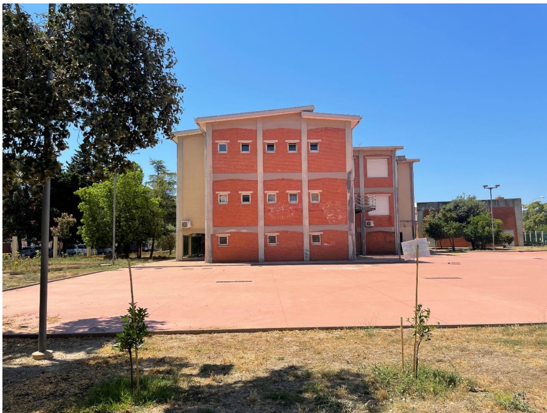
Figura 7: Prospetto lato destro della zona di intervento