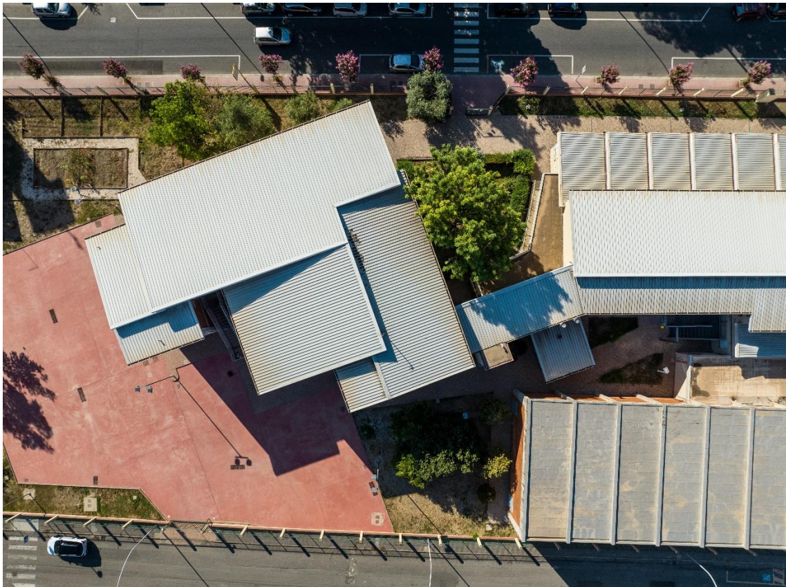
Figura 4: Vista della copertura nella zona di intervento