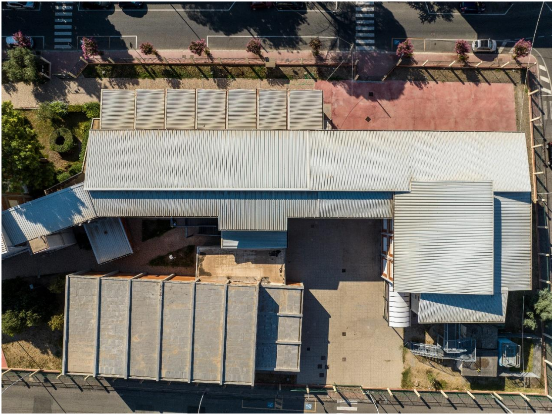
Figura 3: Vista della copertura nella zona di intervento