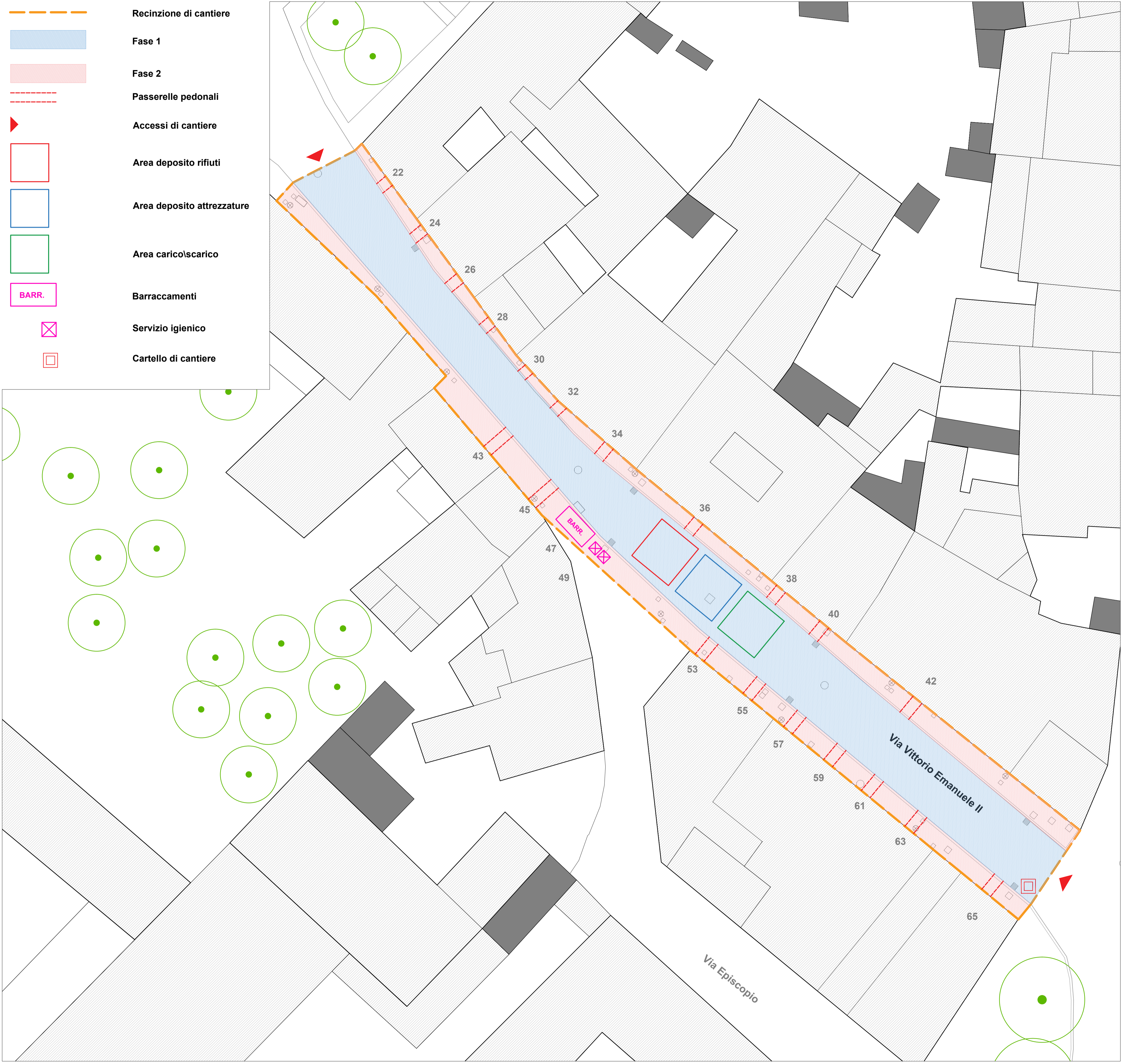
AMBITO VIA VITTORIO EMANUELE - SCALA 1:200