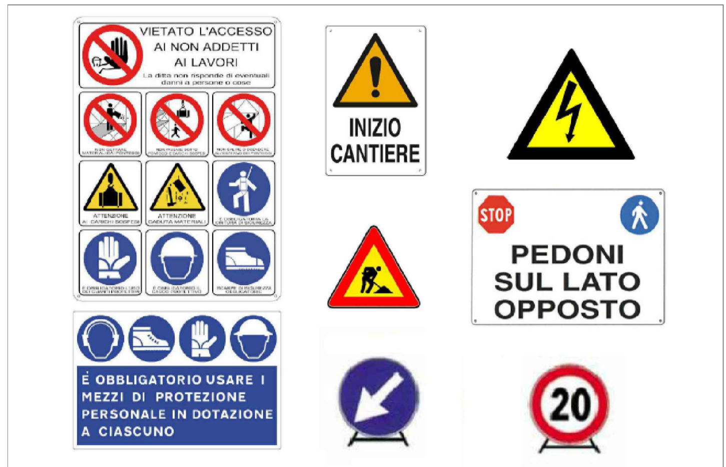
CARTELLONISTICA DI CANTIERE