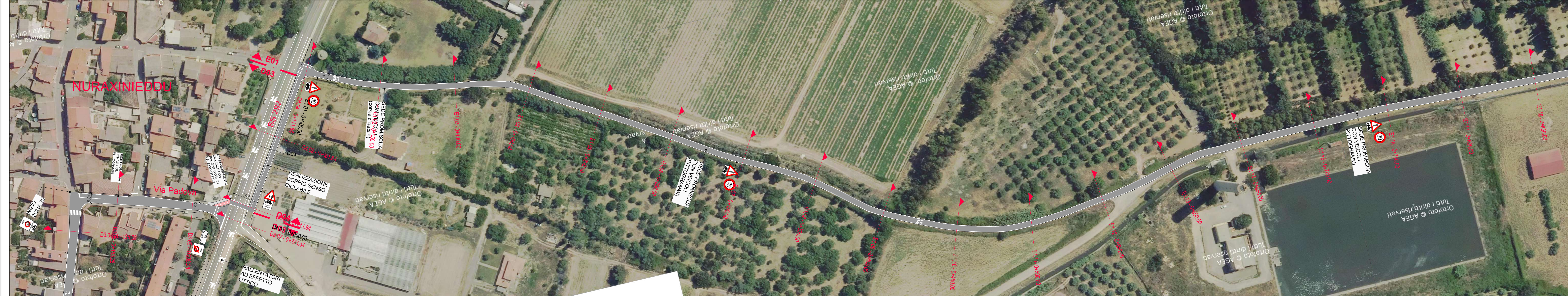
INQUADRAMENTO 3 _ TRATTO E01