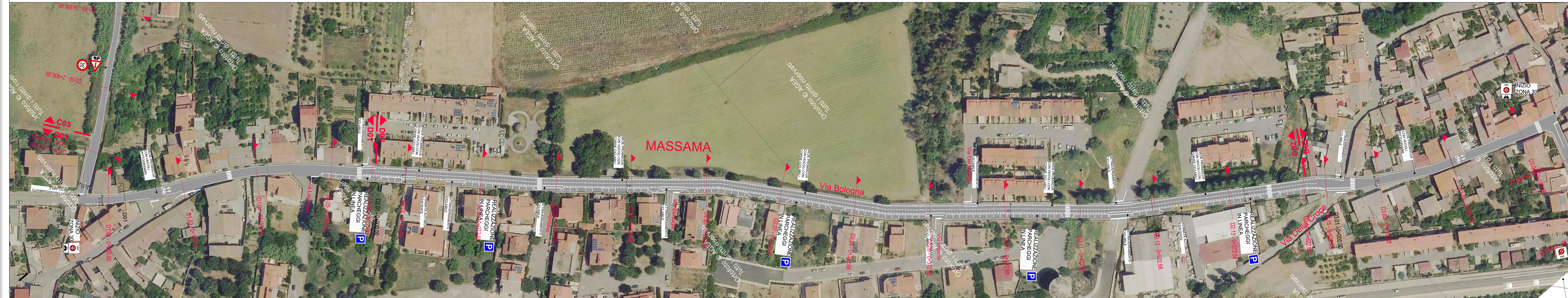
INQUADRAMENTO 2 _ TRATTO D04 - E01