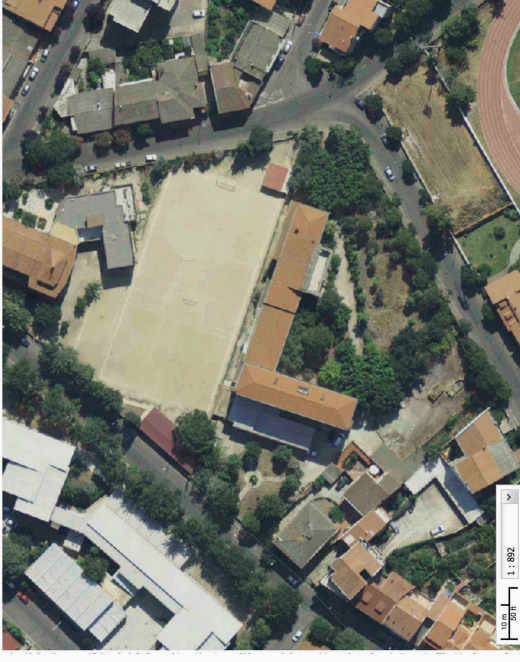
FOTO AEREA EDIFICIO FRASSINETTI

FUTURA Ministero delle Infrastrutture e dei Trasporti Direzione Generale per le Infrastrutture e i Trasporti Direzione Regionale per le Infrastrutture e i Trasporti - Cagliari Direzione Provinciale per le Infrastrutture e i Trasporti - Oristano