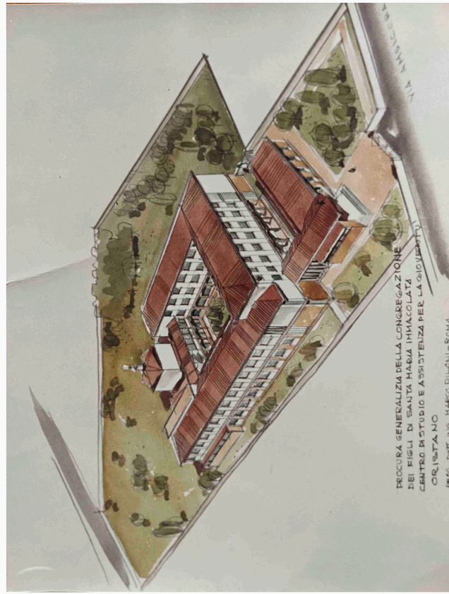
FOTOGRAFIA DEL PROGETTO CENTRO STUDIO E ASSISTENZA ING. M. PILLONI Tratto dal Progetto originale 1968 · Prospettiva