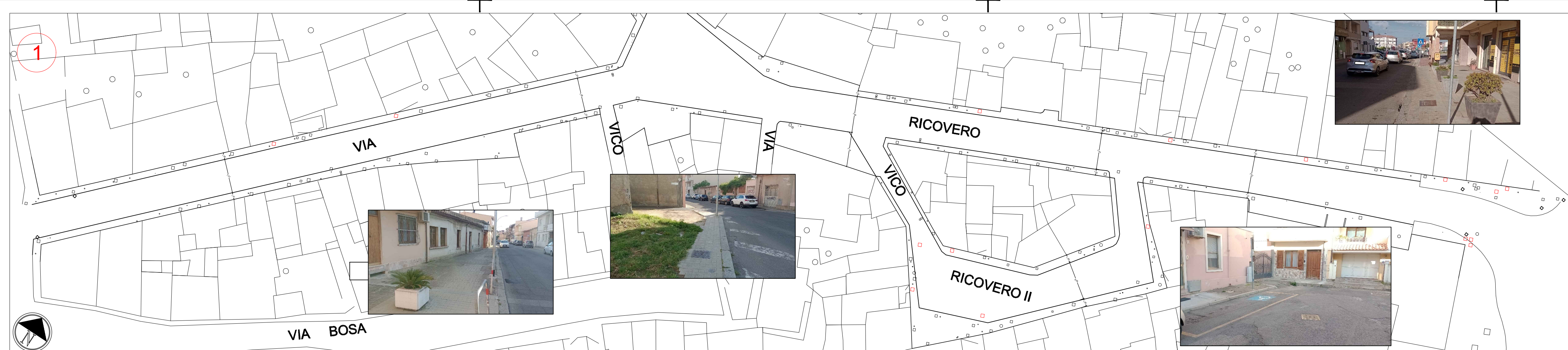
STATO DI FATTO: Planimetria Via Ricovero scala 1:500