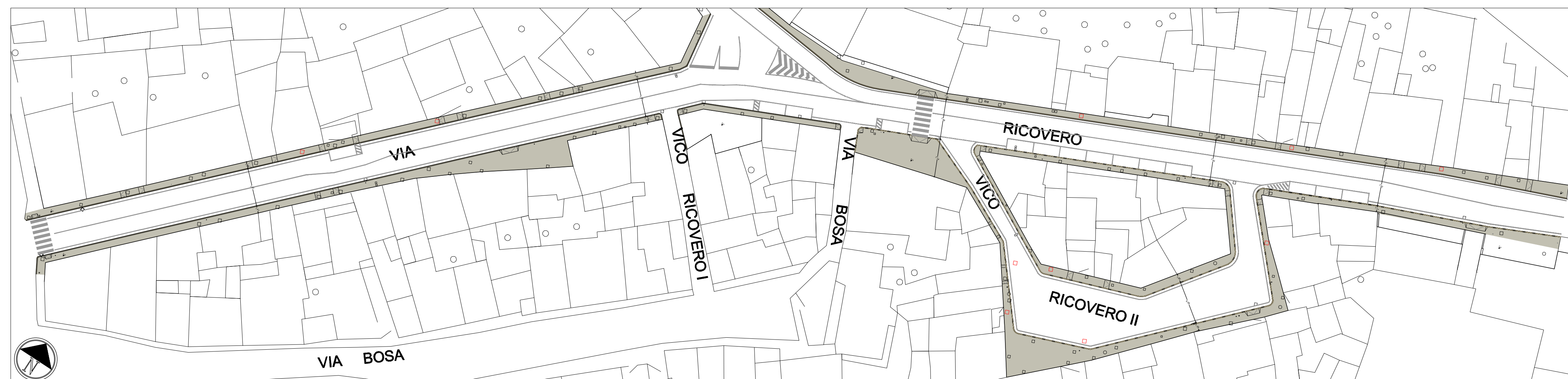
STATO DI PROGETTO: Planimetria Via Ricovero scala 1:500