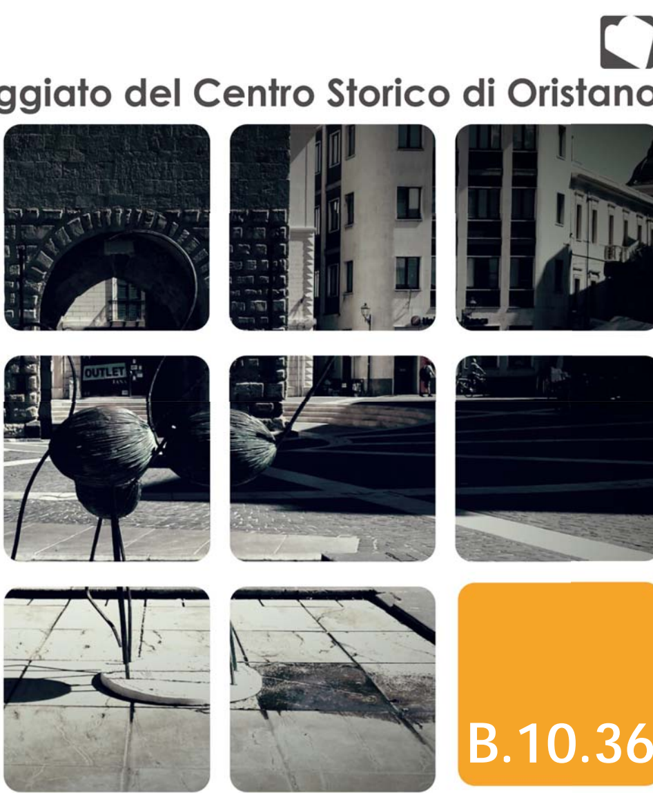
Sviluppo dell'isolato 36